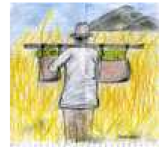
Constance, 11 ans.

L'association Alter Eco a pour objet l'aide au développement des plus pauvres, la participation au Développement Humain dans les pays en Développement et l'Education au Développement dans les pays développés.